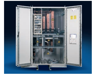
Niederspannungs-Umschalteneinheit Low voltage switch board

Die Auslegung der Transformatoren erfolgt nach den gültigen Bestimmungen DIN/VDE, IEC sowie den erweiterten Bedingungen hinsichtlich der Klima-, Umgebungs- und Brandschutzklasse.