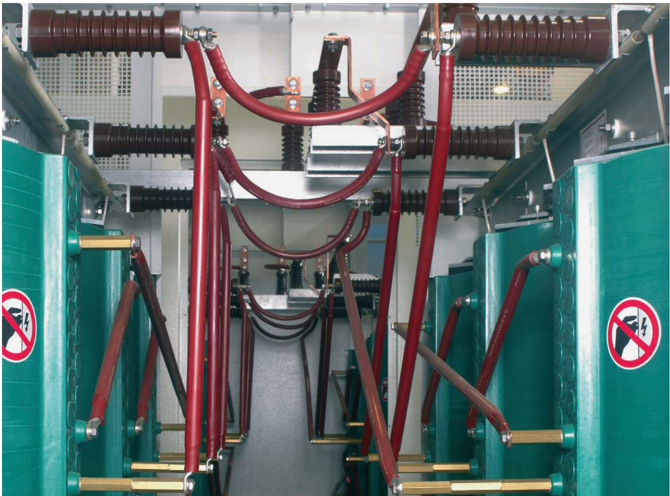
946 kVA 10kV / 2x700V DTR 101000 in Doppelstock-Schwenkzipfelausführung \pm 7,5^\circ 946 kVA 10kV / 2x700V DTR 101000 12 pulse rectifier transformer with phase shift \pm 7,5^\circ

RITZ is certified according to DIN EN ISO 9001 : 2000 and undertakes testing to all applicable international standards. The complete transformer is subject to all routine testing including partial discharge test (pre-tested and complete). Type testing and special tests can be performed on request.