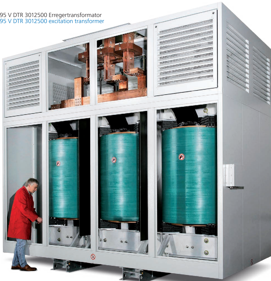
11000 KVA 27KV / 1095 V DTR 3012500 Erregertransformator 11000 KVA 27KV / 1095 V DTR 3012500 excitation transformer

RITZ offers a wide range of pole mounted transformers with outdoor weatherproof enclosures specially designed for pole mounting. RITZ pole mounted cast resin transformers are the preferred substitute for the liquid filled transformers particularly in environmentally sensitive areas. The transformers are designed and tested as a complete assembly unit ensuring safe use and protection against electric shock. The transformers have undergone testing in both wet and dry conditions.