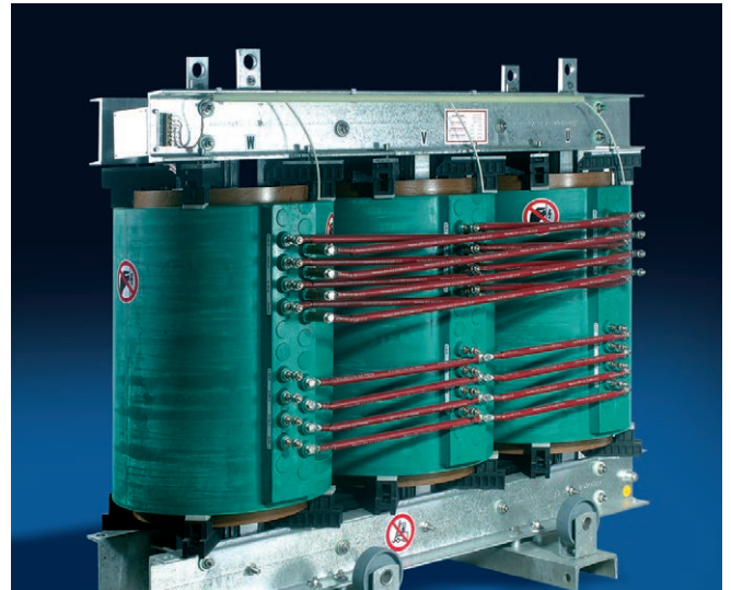
400 kVA 20kV / 8x210V DTR 20800 Doppelstockausführung 400 kVA 20kV / 8x210V DTR 208006 24 pulse rectifier transformer

The copper winding of the High Voltage (HV) coil is insulated using a glass fibre epoxy resin laminate. The HV coil is cast into moulds in a vacuum process with pure epoxy resin. The manufacturing process ensures a cavity free insulating system of the highest quality. The HV coil is free of partial discharge and protected against surges. Tapping links are brought onto the outside of each coil and are readily adjustable when switched off. The HV coils are flameresistant and self extinguishing. The HV coil can be designed with air ducts to cool the windings efficiently at a technically suitable coil length. Tapping links are brought out onto the outside face of each coil and are readily adjustable in deenergized state. The HV coils are hardly inflammable and self extinguishing. In case of fire, no toxic fumes are produced.